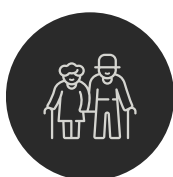
IABV ACHILLE TCHALLA