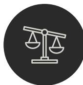
DND DELPHINE THARAUD