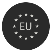
ETAPE HÉLÈNE PAULIAT

D'autres projets de chaires d'excellence sont actuellement en cours de structuration, autour de thématiques émergentes en lien avec les priorités scientifiques et sociétales du territoire.