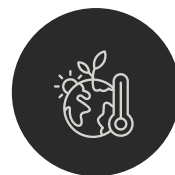
TRACES ÉMILIE CHEVALIER